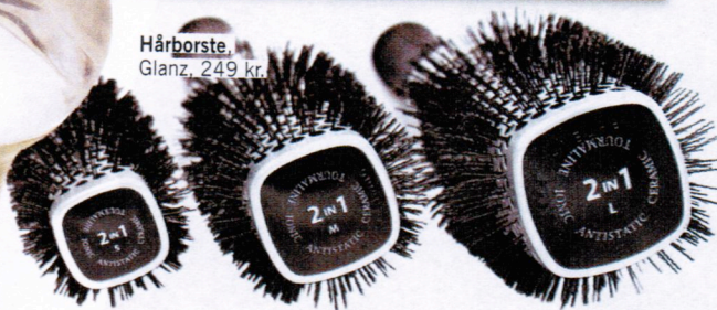
Hårborste, Glanz, 249 kr.

Psst! MAXA VOLYMEN MED ÖL. Öl innehåller jäst och B-vitamin som ger håret volym och glans. Tvätta håret med schampo, håll i öl låt sitta 10–20 minuter. Skölj med balsam.